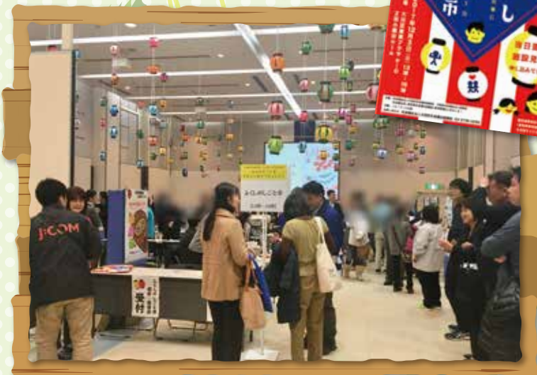
昨年の「ふくしのしごと市（相談面接会）」の様子とチラシ

福祉の課題が複雑化・重層化する中、福祉人材の不足が深刻な問題となっています。地域で困っている方に福祉サービスを継続して提供していくためには、働きやすい職場環境をつくり、人材の定着を図っていく必要があります。法人同士のネットワークを活かして、相談面接会を実施し、各法人が実施する研修に参加しあい、福祉人材の確保・育成・定着を図っています。