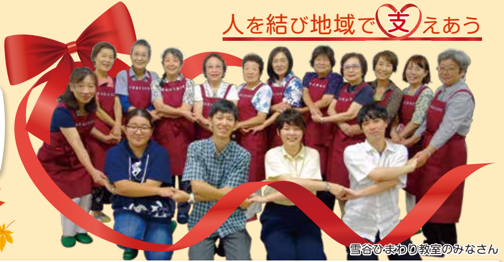
雪谷ひまわり教室のみなさん