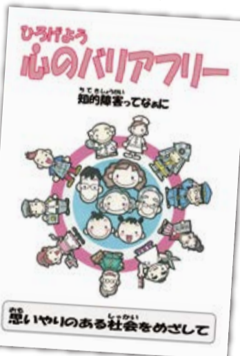
出前講座のテキスト