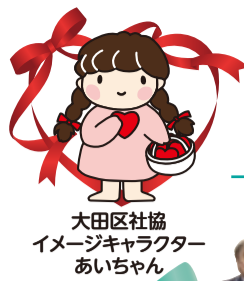
大田区社協 イメージキャラクター あいちゃん

大田区社会福祉協議会は「みんなでつくる 共につながりあう まち」の実現に向けて、地域の皆さまと力を合わせて大田区地域福祉を推進する団体です。