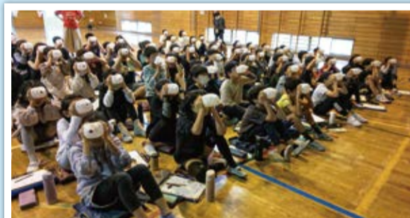
ペットボトルを使って疑似体験をする子どもたち

「大田区手をつなぐ育成会」は、見た目ではわかりにくい知的障害のある人の理解を広げるため、区内の小中学校などで出前講座を行っています。一見不可解に見える行動には必ず本人なりの理由があること、わかりやすく伝える配慮(工夫)について話していきます。地域の中での心の障壁(バリア)を取り払う取組が、少しずつ広がっています。