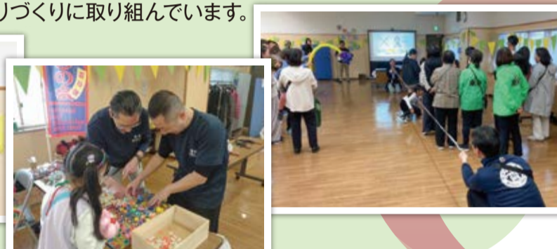
イベントを通して地域のみんな楽しく交流♪