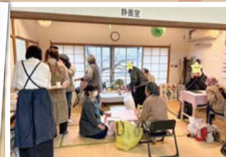
コーヒーの香りたたく和やかなひととき

調布地域にある社会福祉法人が協力をして、生活にお困りの方に食料品を提供する取組(フードパントリー)を、令和6年1月と2月に開催しました。併設したカフェ・相談コーナーに来場した方は、スタッフに気軽に困りごとなどを相談していました。