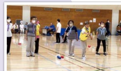
居場所出会った仲間たち

高齢の方が外出するきっかけとしてはじまった「池上ボッチャの会」は、ボッチャを教える人や、試合に出る人、応援する人など、居場所を通じてたくさんのつながりが生まれています。定期的にみんなで集まり、楽しく練習を行っています。