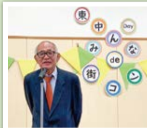
東雪谷東中自治会会長

東雪谷東中自治会で開催された「東中Day! みんなde街コン」は、同じ地区に住む人同士が顔見知りになり、大規模災害等の時にも声を掛けあい、助けあえることを目指しています。ゆるやかなつながりづくりに取り組んでいます。