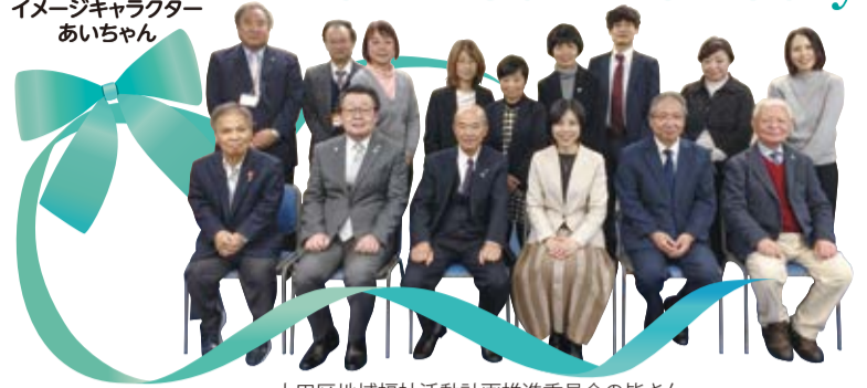
大田区地域福祉活動計画推進委員会の皆さん 2024/3/8

編集・発行 社会福祉法人 大田区社会福祉協議会 〒144-0051 東京都大田区西蒲田7-49-2 ☎ 03-3736-2021 FAX 03-3736-2030 🌐 https://www.ota-shakyo.jp 🐦 https://twitter.com/ota_shakyo