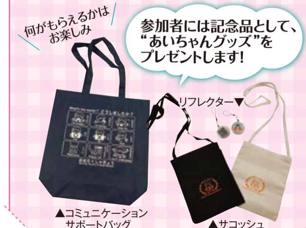
参加者には記念品として、「あいちゃんグッズ」をプレゼントします!

【問合先】計画・組織基盤・人材育成担当 TEL 03-3736-2023 【申込】申込フォームまたはFAX 03-3736-2030 ①希望の会場②氏名③電話番号をお知らせください。