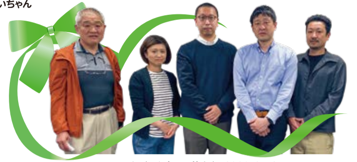
フードバンク大田の皆さん 2023/6/18