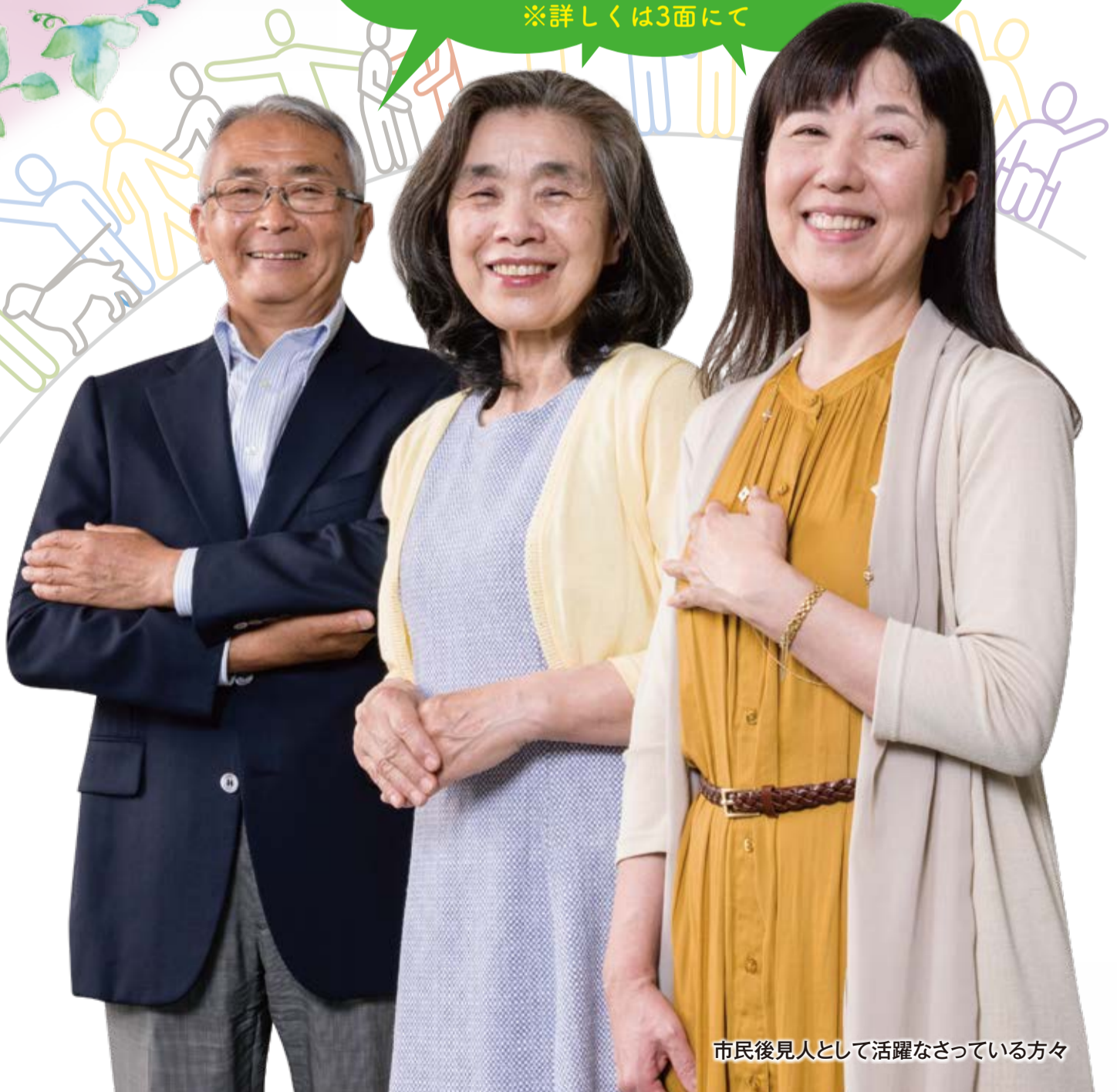
市民後見人として活躍なさっている方々