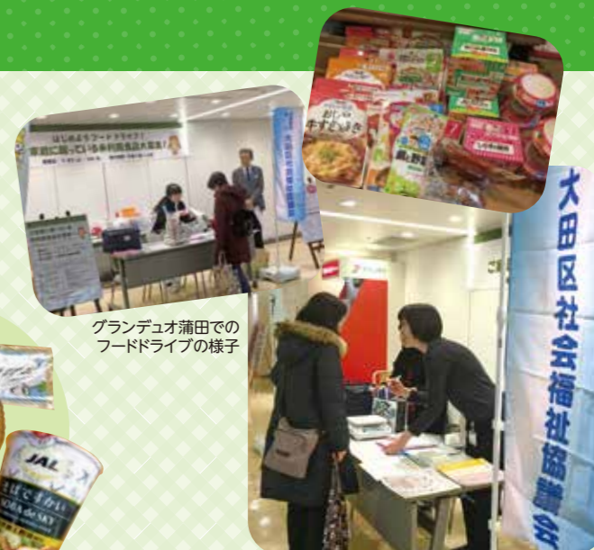
グランデュオ蒲田での フードドライブの様子