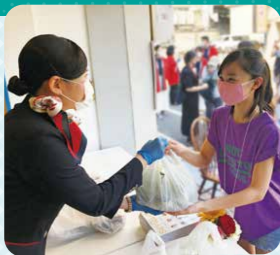
無料で食料を提供するフードパントリー活動 日本航空(株)の社員の方もイベントに参加