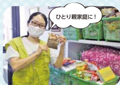
NPO法人グッドネーバース・ジャパン