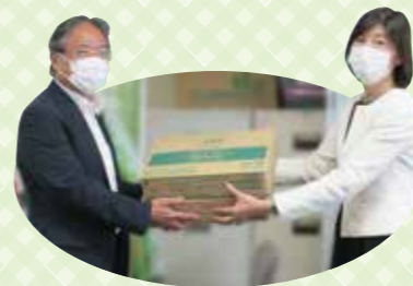
日本航空(株)様よりご寄付を頂きました

誰もが、今すぐにでも始められる地域への貢献活動です。ご家庭や企業の皆さまからいただいた食料は、地域のこども食堂、児童施設等の福祉施設、ひとり親家庭などに、皆さまのお気持ちと共にお届けします。