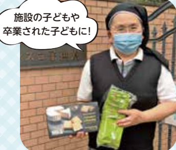
聖フランシスコ子ども寮

コロナ禍が続く中、一時的に生活を維持するための収入を得ることが困難な状況になっている方が増えています。フードパントリーは、ご家庭や企業の皆さんから食料の寄付を募り、必要としている方に無償でお届けする活動です。