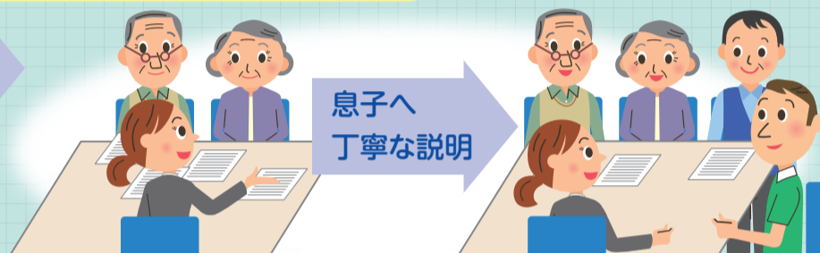
おおた成年後見センター