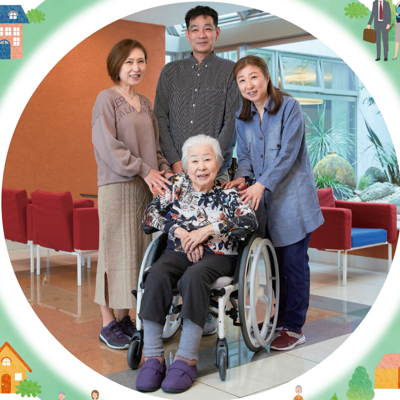
親族後見人(娘)、親族の皆さん 被後見人(お母様)

大田区社会福祉協議会は、「互いに結びあい 共に支えあう まち」の実現に向けて、 地域の皆さまと力を合わせて大田区の地域福祉を推進する団体です。