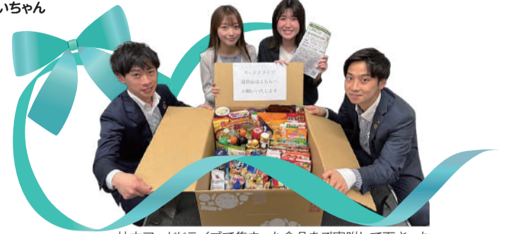
社内フードドライブで集まった食品をご寄附して下さった 大和証券株式会社 蒲田支店の皆さん 2022.5.6

編集・発行 社会福祉法人 大田区社会福祉協議会 〒144-0051 東京都大田区西蒲田7-49-2 ☎ 03-3736-2021 FAX 03-3736-2030 🌐 https://www.ota-shakyo.jp 🐦 https://twitter.com/ota_shakyo