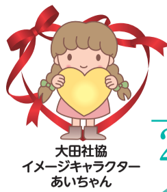
大田社協 イメージキャラクター あいちゃん