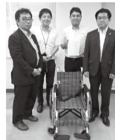
JAM 東京千葉の青年協議会様より自走式車いす1台