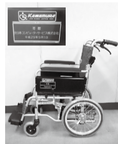
北日本コンピューターサービス株式会社様より車いす5台(自走式3台、介助用2台)