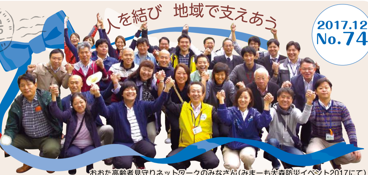
おおた高齢者見守りネットワークのみなさん(みまも犬森防災イベント2017にて)