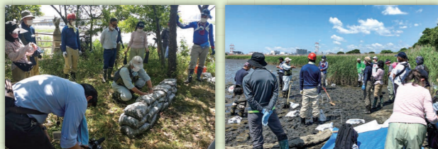
浸水被害の際に必要な、汚泥除去作業の体験を多摩川大師橋干潟で行いました。

5月 5月28日(土) 災害ボランティア育成講座 ～水害被害・汚泥除去作業体験～