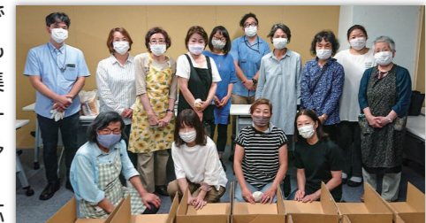
6月17日実施・箱詰め作業 @おおた社協