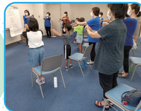
8月3日・10日実施 @おた社協