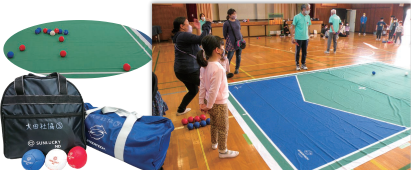
11月12日 @ 東萩谷小学校 親子で体験

ユニバーサルスポーツは障がいの有無や世代に関わらず誰もが一緒に楽しめるスポーツです。おた社協では、カーレットとボッチャの用具貸出しと指導者の派遣をしています。東京パラリンピックで金メダルを取ったこともありボッチャの貸出しが増え、体験した方々は「楽しかったー!」とリピーターになっています。ボールセットを購入した団体も複数あり、地域の交流の場づくりにご利用いただいています。