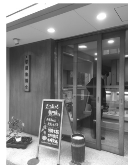
甘藷生駒 (平成28年4月~)