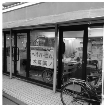
(有) ケアステーション桃の木 (平成29年3月~)