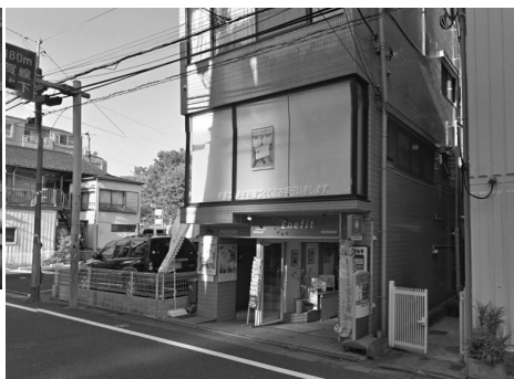
(株) 原商店 (平成28年12月~)