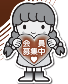
イメージキャラクター 愛ちゃん