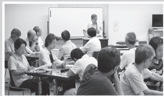
7月13日(月) 32名の方の参加により、「高齢者社会と高齢期の職業生活」をテーマに、再就職支援セミナーを開催しました。

●申込み・問合せ先 大田区 いきいき しごと ステーション ☎5713-3600 / ホームページ www.ota-shigoto.jp