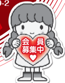
イメージキャラクター 愛ちゃん