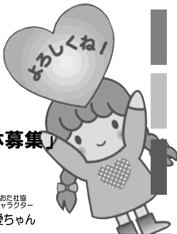
おおた社協 キャラクター 愛ちゃん