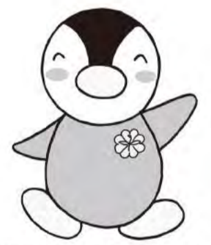
東京都民生委員児童委員のキャラクター ミンジー

今年の11月30日で、民生委員児童委員の3年間の任期が終了となります。12月1日から始まる新しい3年間もよろしく願いいたします。