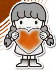
イメージキャラクター 愛ちゃん

《社協とは》 区民の皆様の会費や善意を 受けて、地域の皆さまとっしょに 福祉のまちづくりをすすめている団体です