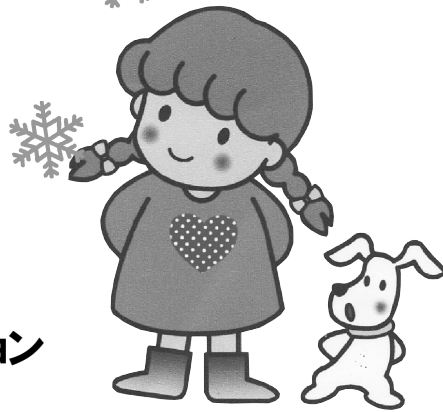
おおた社協 キャラクター 愛ちゃん