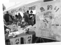
お天気に恵まれ、大盛況でした

11/2・3に開催されたOTAふれあいフェスタ2014(区主催)には社協も参加。お子さん向けの魚釣りゲームと掘り出し物バザーは大盛況でした。たくさんのバザー用品を提供いただき、ありがとうございました。バザーの収益は、地域福祉の向上に役立てさせていただきます。