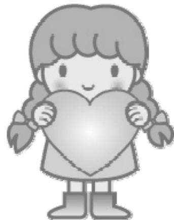
おおた社協 キャラクター 愛ちゃん

障がい理解講座 ● 知ることからはじめよう 「精神障がいの方を地域で支えるために」