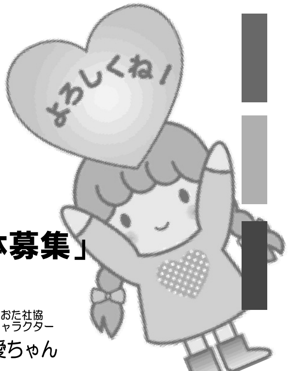
おおた社協 キャラクター 愛ちゃん

社会福祉法人 大田区社会福祉協議会 ボランティア・区民活動センター 〒144-0051 大田区西蒲田 7-49-2 大田区社会福祉センター 5F 開所日時 (月)～(土)9:00～17:00 《祝日・年末年始を除く》