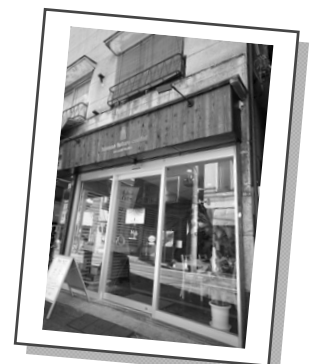
お気軽に立ち寄ってください。

東蒲田2丁目キネマ通り商店会の空き店舗を改装したスペースで、コミュニティカフェの運営などをお手伝いください。 日時:月~金 10:00~16:00のうち 週2~3日、1日2時間以上 人数:女性2名 申込:TEL3573-5692 メール wupfilm@gmail.com NPO 法人ワップフィルム 菊地(東蒲田2-20-2)