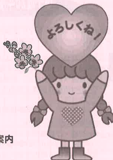
おおた社協 キャラクター