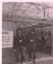
ぜん訪問看護ステーションの看護師の方

押し花を使ったキャンドルづくりでは、色とりどりの花びらを使い個性ある作品の完成。食後は、隣接するビニールハウスでいちご狩り。今回は、8名のボランティアの方に区内のぜん訪問看護ステーションの社会貢献活動として、男性看護師の方2名も同行いただきました。長距離移動となりましたが、無事春を満喫した楽しい一日を過ごすことができました。参加、協力いただきました方々へ感謝!