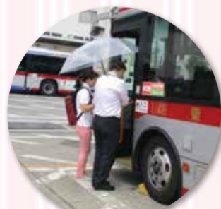
東急バスの営業所をお借りして、乗降の練習