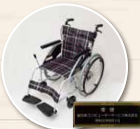
車いす寄附(自走式2台、介助式3台) 北コンピュータサービス株式会社様