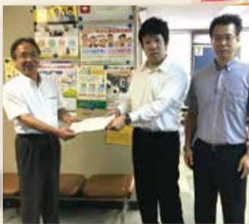
三和電業株式会社様