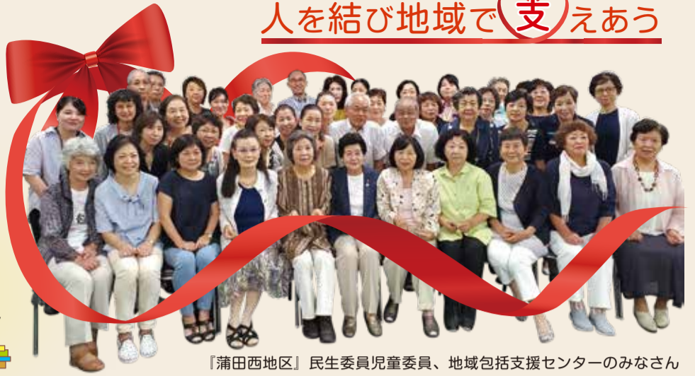
『蒲田西地区』民生委員児童委員、地域包括支援センターのみなさん