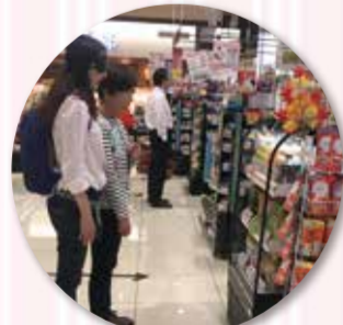
ライフ西蒲田店での買い物演習