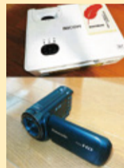
プロジェクター・ビデオカメラ