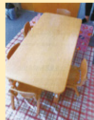
木製折りたたみテーブル・椅子