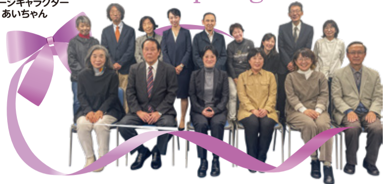
市民後見人交流会に参加の皆さま 2024/11/12

編集・発行 社会福祉法人 大田区社会福祉協議会 〒144-0051 東京都大田区西蒲田7-49-2 ☎ 03-3736-2021 FAX 03-3736-2030 🌐 https://www.ota-shakyo.jp 📱 https://x.com/ota_shakyo