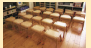
新・おぎょうぎチェア