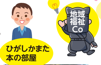
ひがしかまた本の部屋