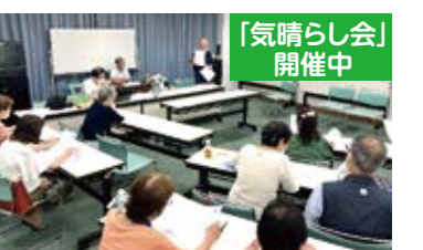
「気晴らし会」開催中

前 はじめは男性のみの日本史の会をイメージしていたけれど、多くの方に分かりやすいように、仲間が大河ドラマの映像をプロジェクターで見られるようにしてくれたり、地域包括支援センターの協力のおかげで女性メンバーも増えました。臨機応変に変化していきました。