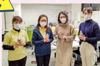
株式会社カラース 様

株式会社ヒダロジスティックス様より5万枚、そして、株式会社YONEDA様より4万枚の不織布マスクをご寄附いただきました。区内の福祉施設等、業務上マスクを必要としている団体などで活用させていただきます。