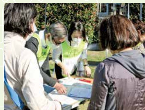
大森東特別出張所(大森東地区)