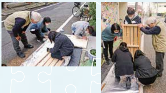
高齢者や妊婦さん、障がいのある人にやさしいイスが完成!

※1: 蒲田西特別出張所・地域包括支援センター西蒲田・大田社協による協働プロジェクト