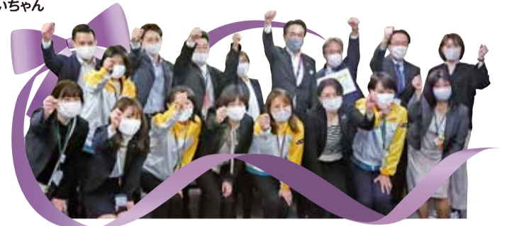
明治安田生命保険相互会品川支社ならびに大田区内の営業所の皆さま 令和2年10月から11月までの期間に社内にてフードドライブを実施

編集・発行 社会福祉法人 大田区社会福祉協議会 〒144-0051 東京都大田区西蒲田7-49-2 ☎ 03-3736-2021 FAX 03-3736-2030 🌐 https://www.ota-shakyo.jp 🐦 https://twitter.com/ota_shakyo