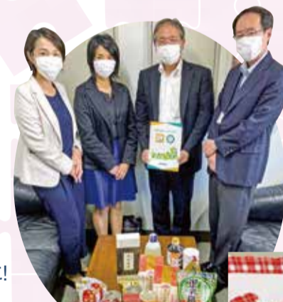
明治安田生命保険相互会社 品川支社 様

明治安田生命保険相互会社品川支社 および大田区の営業所の皆さまが、地元の元気プロジェクトの一環としてフードドライブを実施され、集まった食品を大田社協に寄附してくださいました。お預かりした食品は、支援を必要としている方々にお渡しします。