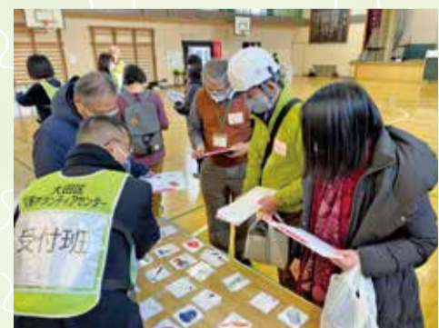
こらぼ大森(大森西地区)

近年、自然災害が頻繁に発生し、甚大な被害もたらされているのは記憶に新しいところです。コロナ禍の現在は、区外からの災害ボランティアによる支援を受けるのが厳しい状況ですが、今後、被災者になる側と被災地を支援する側の知識やシミュレーションを地域で役立てる時が来るかもしれません。