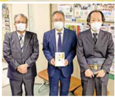
公益社団法人蒲田法人会 様