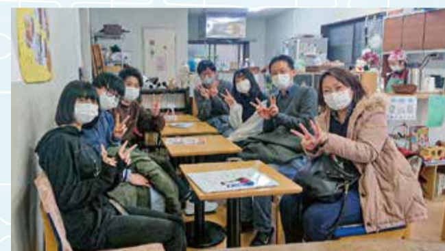
コミュニティスペースにしかまた