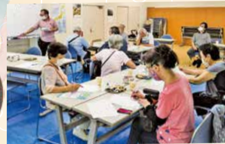
公園カフェ「ふらっと」(蒲田本町)