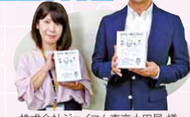
株式会社ジェイコム東京大田局 様