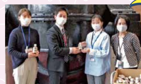
株式会社荏原製作所 様

株式会社荏原製作所様よりカフェオレをご寄附いただきました。お預かりした飲料は、コロナ禍の高齢者を在宅介護で支えている株式会社カラース様へお届けしました。