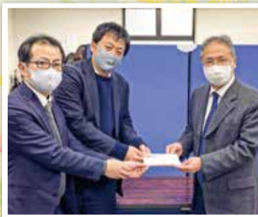
アルプスアルパイン株式会社 様