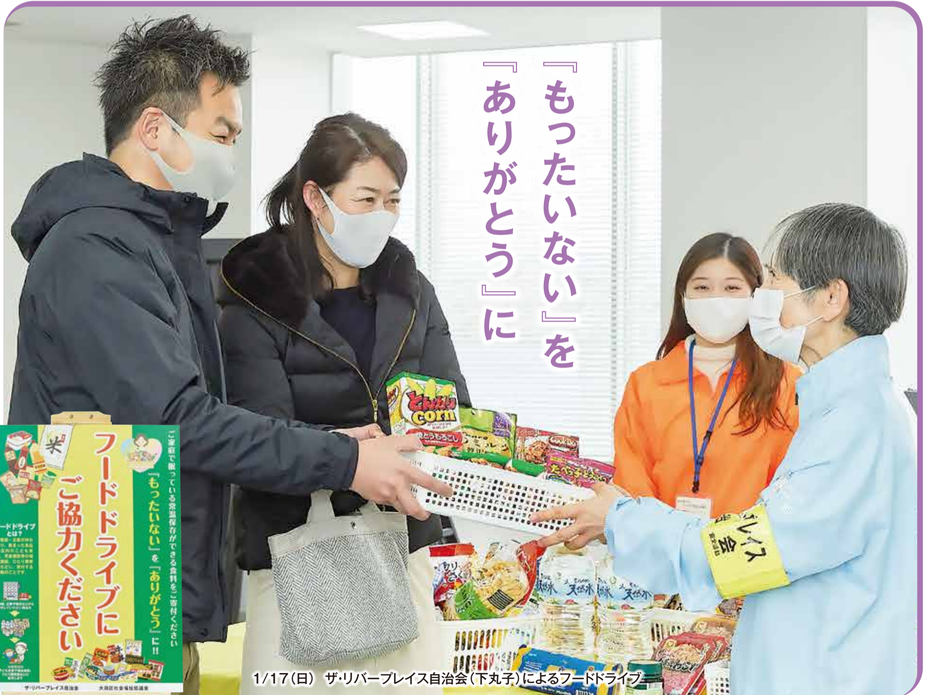
1/17(日) ザ・リバープレイス自治会(下丸子)によるフードドライブ