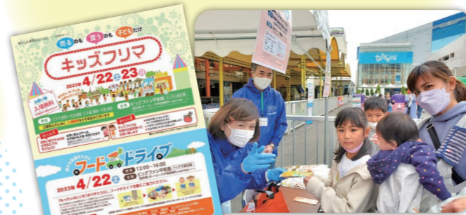
▲京急開発株式会社

R5年4/22(土) BIG FUN平和島にて フードドライブが開催されました。 計102.35kgの食品が集まりました。