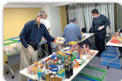
▲株式会社エクシオテックの皆さん