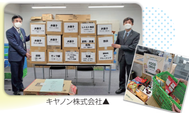
キヤノン株式会社▲