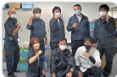
▲大国屋電機工業株式会社の皆さん