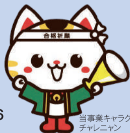
当事業キャラクター チャレニャン

今年度の申込書類提出期限は 令和5年2月3日(金) です。 申込希望の方は 令和5年1月20日(金) までに ご相談ください。