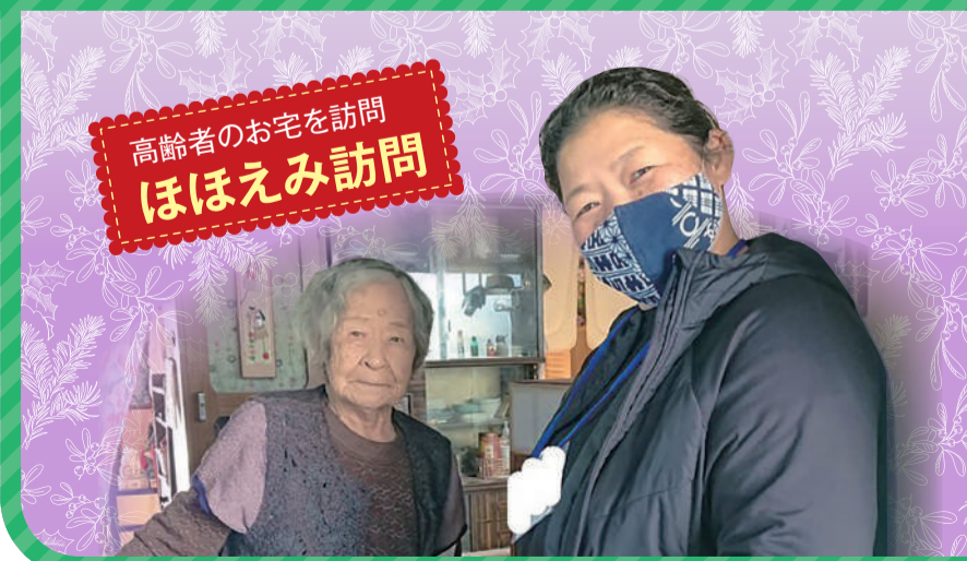
高齢者のお宅を訪問 ほほえみ訪問