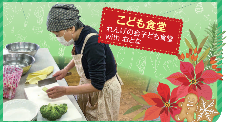
こども食堂 れんげの会子ども食堂 with おとな

大田区社会福祉協議会は、「互いに結びあい 共に支えあう まち」の実現に向けて、 地域の皆さまと力を合わせて大田区の地域福祉を推進する団体です。