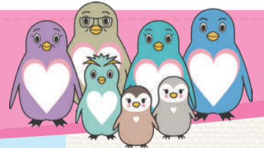
さとべんファミリー 東京都里親制度PRキャラクター