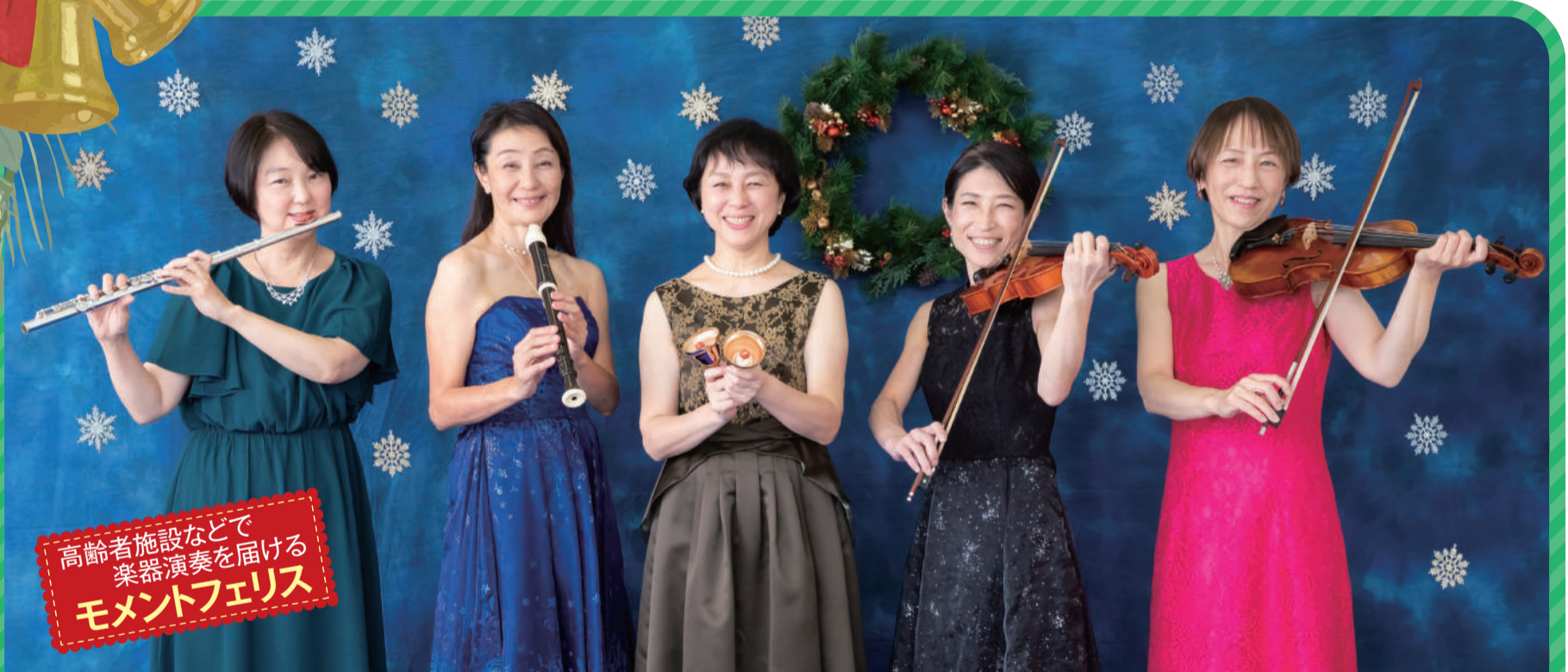
高齢者施設などで 楽器演奏を届ける モメントフェリス