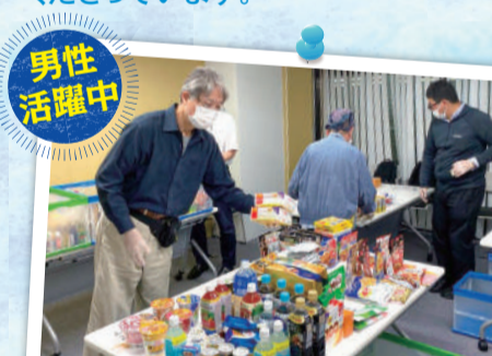
株式会社エクシオテック

地域の方や企業の地域貢献として(大国屋電機工業株式会社様、株式会社エクシオテック様)が活動してくださっています。