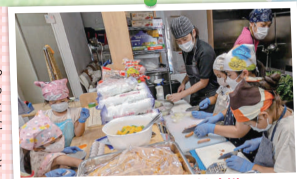
おおたラーメン子ども食堂