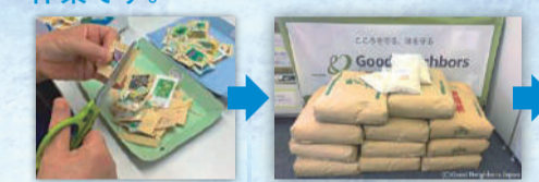
認定NPO法人クッドネーバースジャパン

使用済み切手を換金して精米を購入し、ひとり親世帯に配布します。区内から集まった使用済み切手を切り取り、整理する作業です。