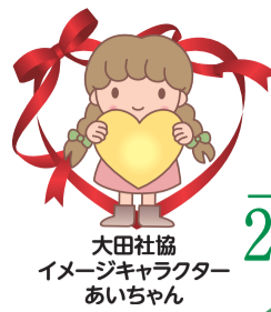
大田社協 イメージキャラクター あいちゃん