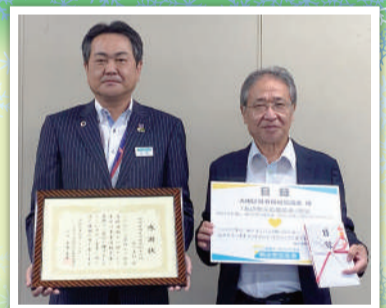
明治安田生命保険相互会社 品川支社様