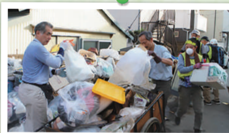
令和元年10月 台風19号の時の災害ボランティア活動の様子

災害ボランティアはいざというときの地域の力です。災害が起こった際に生活再建をいち早く進めるお手伝いをします。