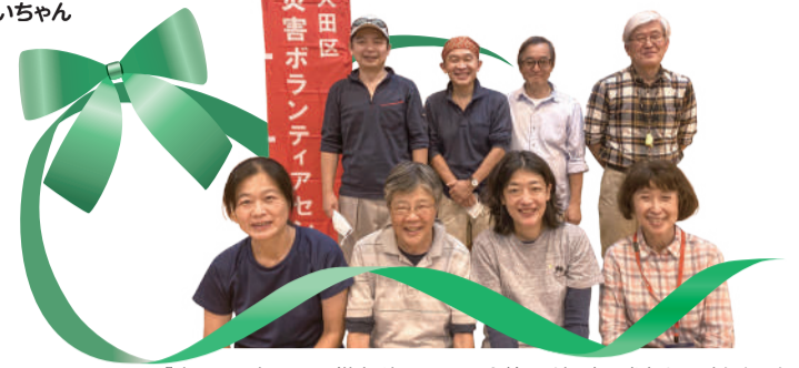
「来て見て知って 災害ボランティア」(矢口地区)に参加して下さった 大田区災害ボランティアの皆さん 2022/10/16

編集・発行 社会福祉法人 大田区社会福祉協議会 〒144-0051 東京都大田区西蒲田7-49-2 ☎ 03-3736-2021 FAX 03-3736-2030 🌐 https://www.ota-shakyo.jp 🐦 https://twitter.com/ota_shakyo