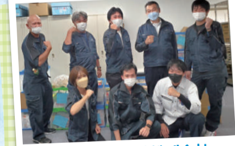
大国屋電機工業株式会社