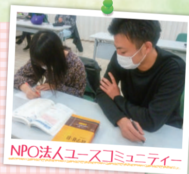
NPO法人ユースコミュニティ