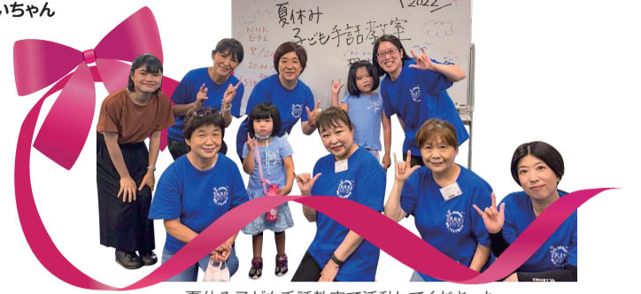
夏休み子ども手話教室で活動して下さった 相生子ども手話の会の皆さん 2022/8/3-10

編集・発行 社会福祉法人 大田区社会福祉協議会 〒144-0051 東京都大田区西蒲田7-49-2 ☎ 03-3736-2021 FAX 03-3736-2030 🌐 https://www.ota-shakyo.jp 🐦 https://twitter.com/ota_shakyo