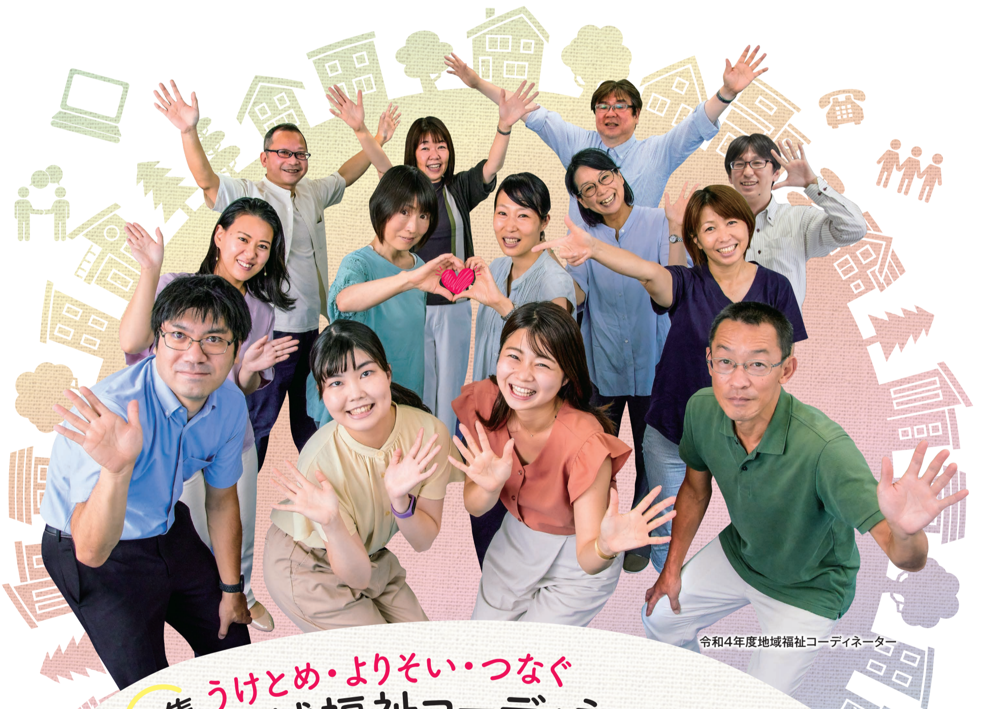
令和4年度地域福祉コーディネーター

特集 うけとめ・よりそい・つなぐ 地域福祉コーディネーター ～地域と共につくるまちづくり～ ……2.3 ●マンガでみる! 任意後見ものがたり ……4