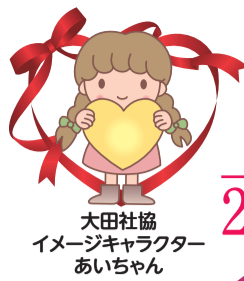
大田社協 イメージキャラクター あいちゃん