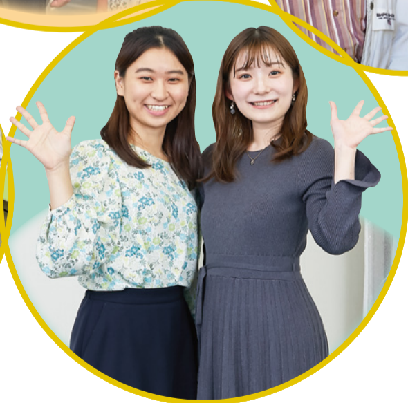
● 学生が運営する こども食堂「はちみつ食堂」で 活動しているお二人

大田区社会福祉協議会は、「互いに結びあい 共に支えあう まち」の実現に向けて、 地域の皆さまと力を合わせて大田区の地域福祉をすすめる団体です。