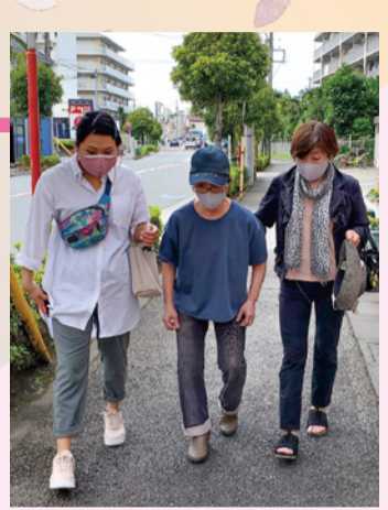
コロナワクチン接種サポート 同行ボランティア(左)

地域のボランティアによるコロナワクチン接種サポート(予約サポート・同行サポート)が始まりました。同行サポートでは、ボランティアの皆さんが利用者宅の往復を優しい声がけをしながら付き添っていただきました。