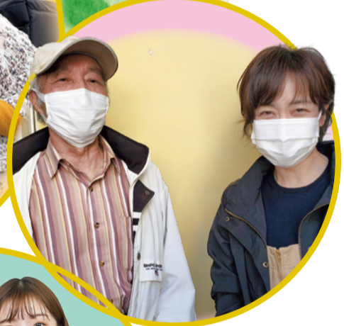
● コロナワクチン 接種サポート 同行ボランティア(右)