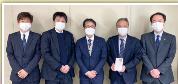
アルプスアルパイン株式会社 様