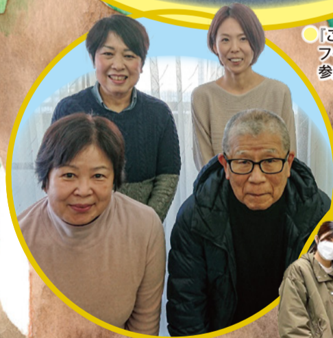
● 介護認定調査員の皆さん