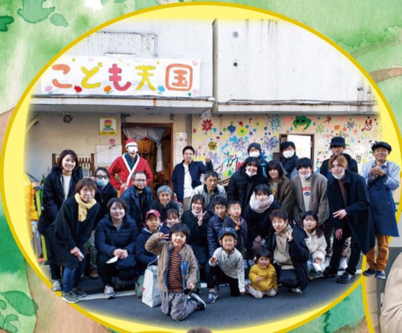
● 「こども天国」での フードパントリーに 参加された皆さん