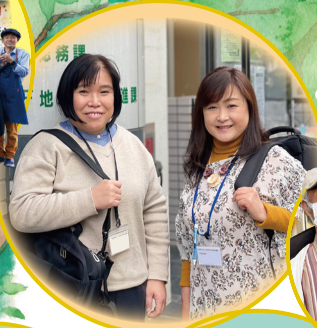
● 地域福祉権利擁護事業 生活支援員のお三人