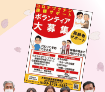
コロナワクチン接種サポートをしてくださった「大田スカイパソン同好会」の皆さん