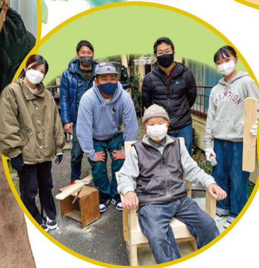
● 蒲田西プラットフォーム 「みんなのイスプロジェクト」に 参加された皆さん