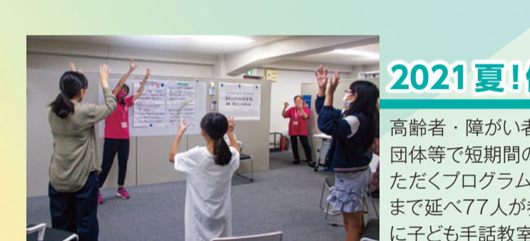
夏休み子ども手話教室の様子

「地域の新たなチカラ」地域貢献活動について考えてみよう」をテーマに、ゲストに地域活動団体の方々をお迎えし、オンラインイベントを6/30(水)に開催しました。企業の皆さんの持つ強みが地域に加われば、これほど心強いことはありません。コロナ禍の中、地域のために取り組んでくださる様々な企業の方々の活動内容を知る機会にもなりました。