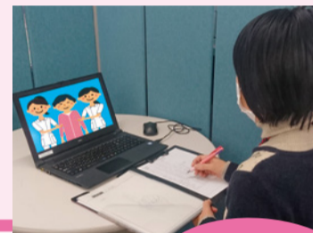
認定調査員募集中

要介護認定調査において、距離をとると聞こえにくい場合には質問カードを使用などの配慮をしました。また一部病院の調査では院内の相談室と病室をリモートで結び、病室で申請者の動作がよく見えるよう看護師さんに協力していただきました。