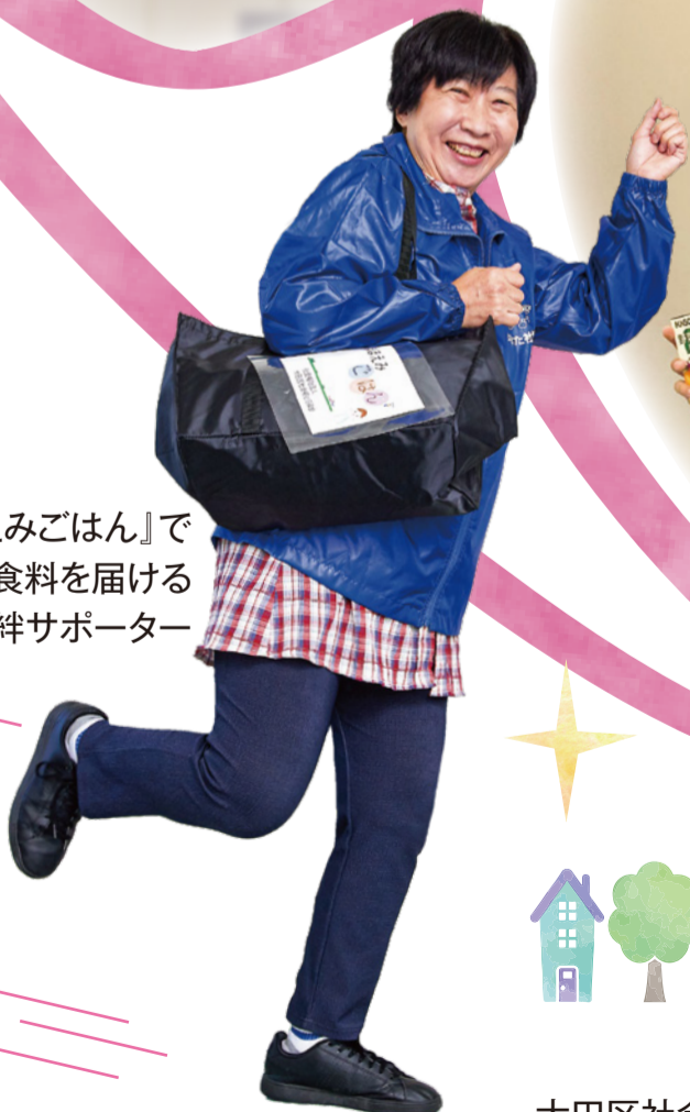
『ほほえみごはん』で 食料を届ける 絆サポーター