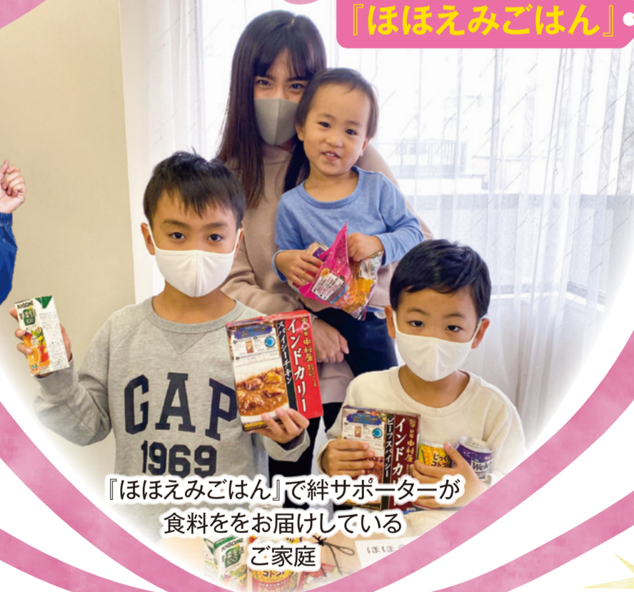
『ほほえみごはん』で絆サポーターが 食料ををお届けしている ご家庭