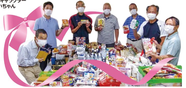
フードドライブで集まった食料の仕分けをして下さった助っ人サービスの皆さん