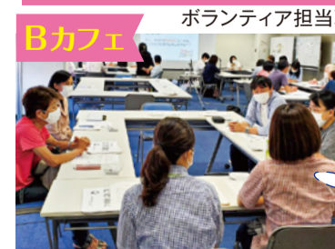
ボランティア担当職員▲

絆サポーターに登録した後も、会員同士の交流会(Bカフェ)を実施し、日頃の活動の情報交換をしています