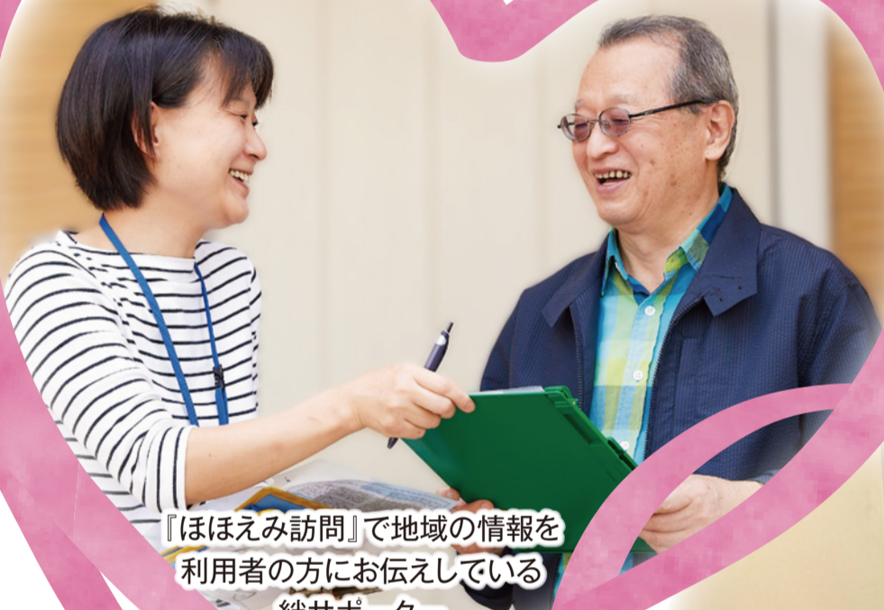
『ほほえみ訪問』で地域の情報を 利用者の方にお伝えしている 絆サポーター