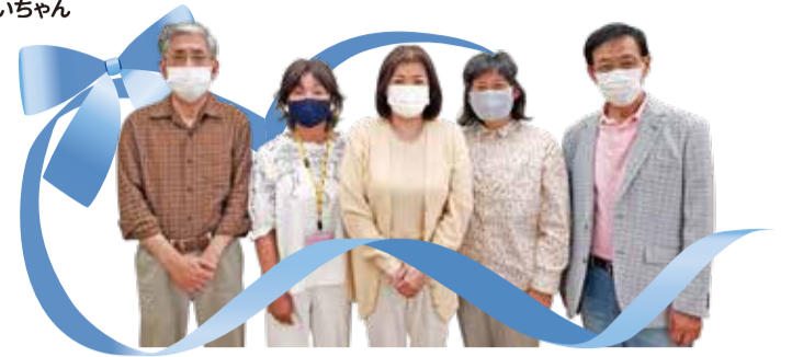
コロナワクチン接種サポートをしてくださった「大田スカイパソコン同好会」の皆さん (場所:ローソンホーム薬局西蒲田店)2021.6.1

編集・発行 社会福祉法人 大田区社会福祉協議会 〒144-0051 東京都大田区西蒲田7-49-2 ☎ 03-3736-2021 FAX 03-3736-2030 🌐 https://www.ota-shakyo.jp 🐦 https://twitter.com/ota_shakyo