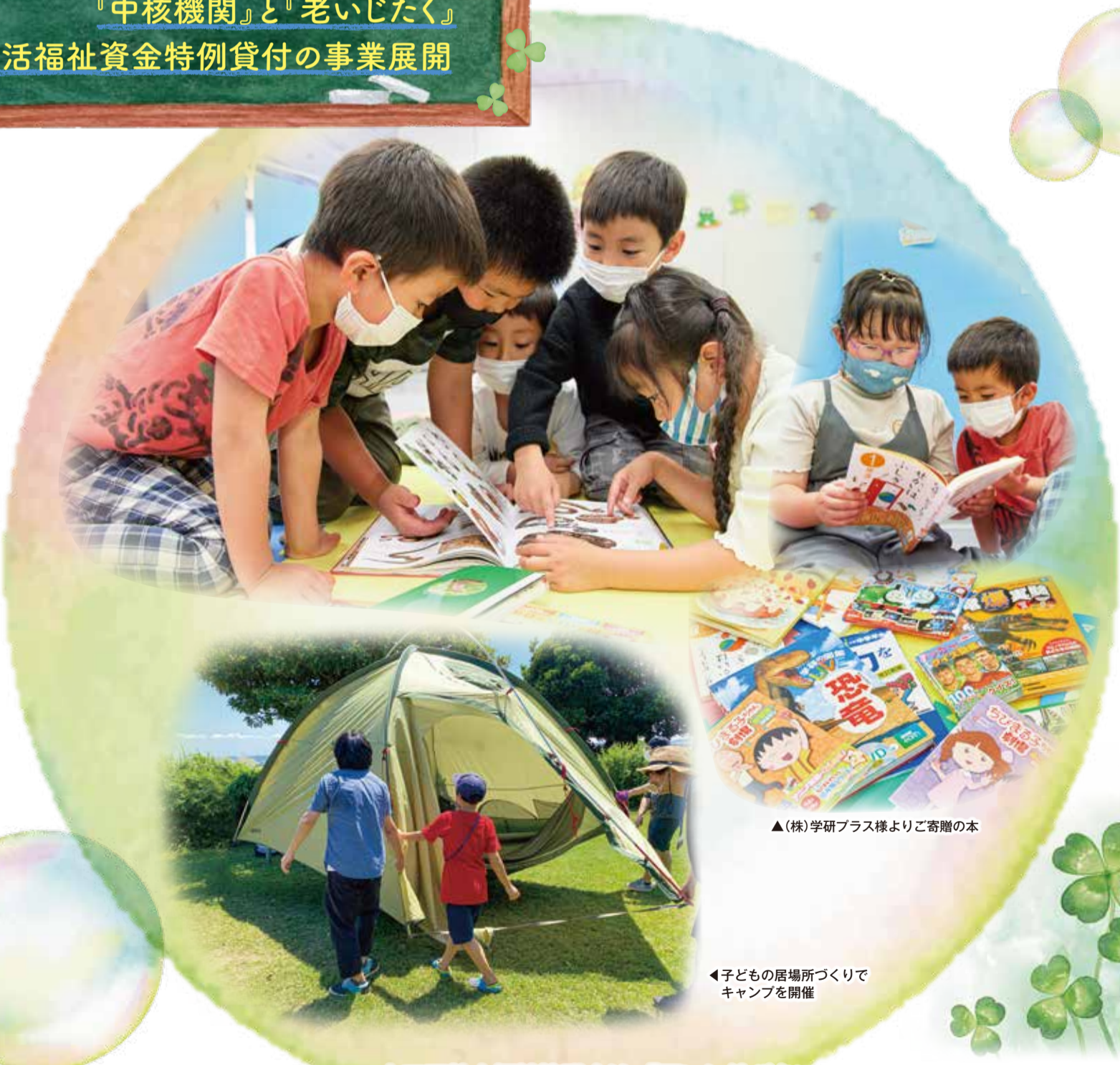
▲(株)学研プラス様よりご寄贈の本