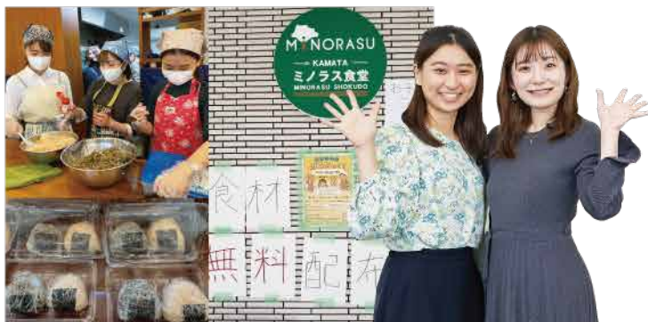
現在はスタイリオウイズ上池台からミノラス食堂(蒲田)へ場所を変え、活動をしています

子どもたちが喜んでる姿を見るだけで「やって良かった!」と思いますし、大田区という地域のことを知る機会にもなったと感じています。こんなにも地域のことを愛している人がたくさんいるなんて、本当に感激です。これからもずっと学生主体の『はちみつ食堂』を運営していきたいと考えていますので、ぜひ私たちの後に続くボランティアの参加をお待ちしています。