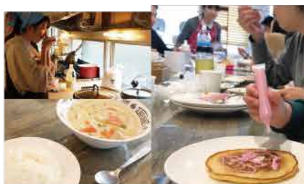
コロナ禍前は、温かい料理を出していました

ゲットを絞ってピラをポスティングしたところ、それを見て来てくださる方が増えていきました。また、コロナ禍でいったん閉めた『はちみつ食堂』を再開する際は、こども食堂連絡会の方たちにサポートしていただき、とても助かりました。