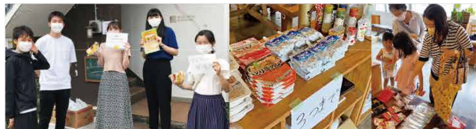
コロナ禍中、様々な方の協力のもと活動を再開、6/21に食料配布(フードパントリー)を行いました