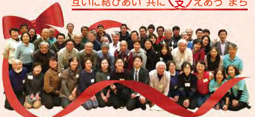
NPO・区民活動フォーラム実行委員のみなさん

編集・発行 社会福祉法人 大田区社会福祉協議会 〒144-0051 東京都大田区西蒲田7-49-2 ☎ 03-3736-2021 FAX 03-3736-2030 🌐 https://www.ota-shakyo.jp 🐦 https://twitter.com/ota_shakyo