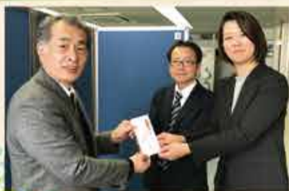
アルプスアルパイン株式会社 様