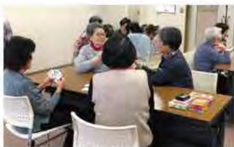
楽しく仲間づくり なつかしい昔遊びに会話ははずみず