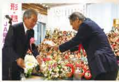
JA健康長寿倶楽部 人形供養祭実行委員会様