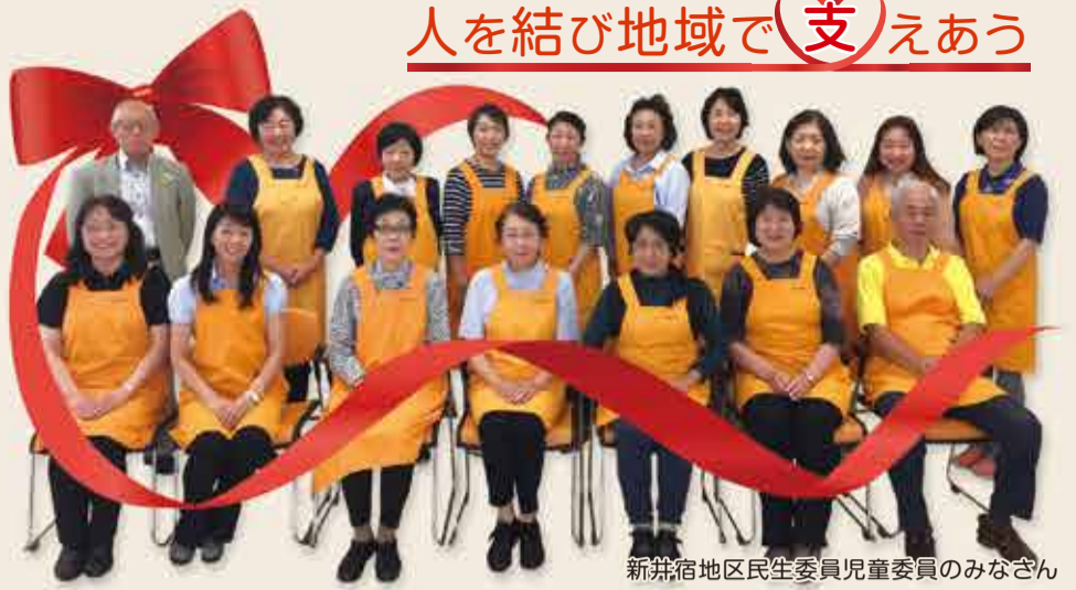
新井宿地区民生委員児童委員のみなさん