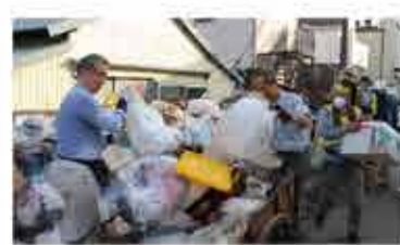
東京新聞 令和元年10月21日掲載