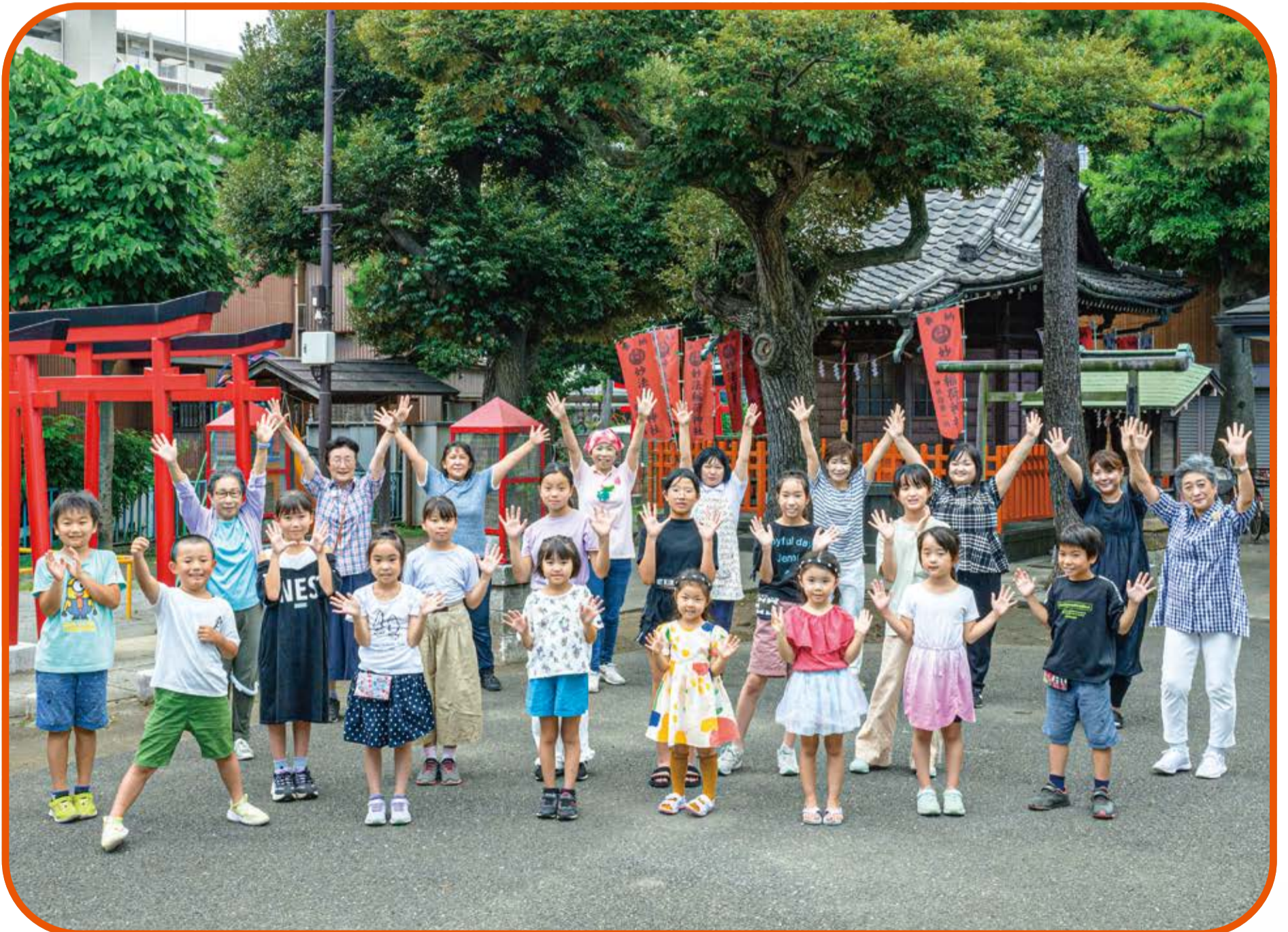
本羽田一丁目町会盆踊り会 & おおたラーメン子ども食堂 (本羽田一丁目町会会館にて)

大田区社会福祉協議会は、「互いに結びあい 共に支えあう まち」の実現に向けて、地域の皆さまと力を合わせて大田区の地域福祉を推進する団体です。