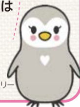
さとべんファミリー

里親制度に関するご相談はこちらまで フォスターング機関六踏園 〒140-0001 東京都品川区北品川3-7-21 TEL:03-3474-5442 (東京都品川児童相談所)