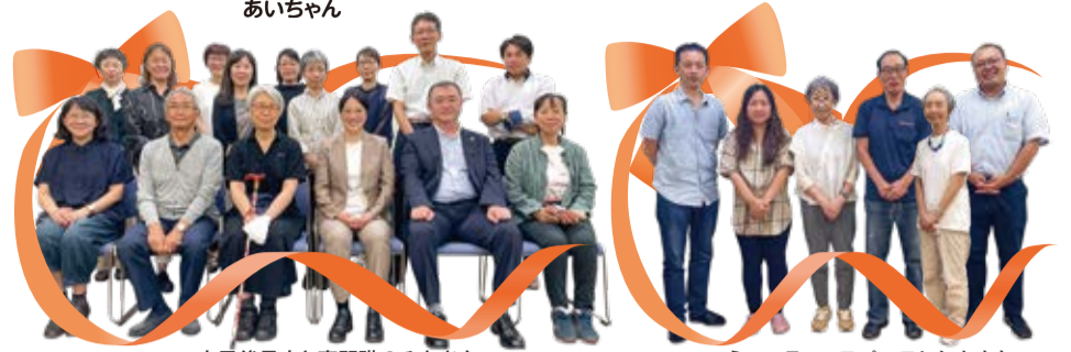
市民後見人と専門職のみなさん 2023/6/20