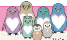
さとべんファミリー 東京都里親制度PRキャラクター