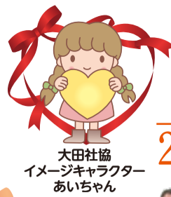
大田社協 イメージキャラクター あいちゃん