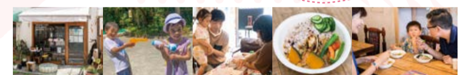
大田区内のカフェスペース「おやこcafe verde」をお借りして『子ども夏祭り』を開催しました！